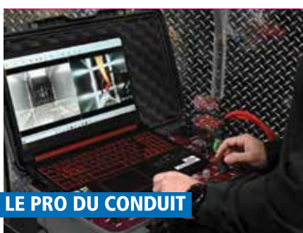
LE PRO DU CONDUIT